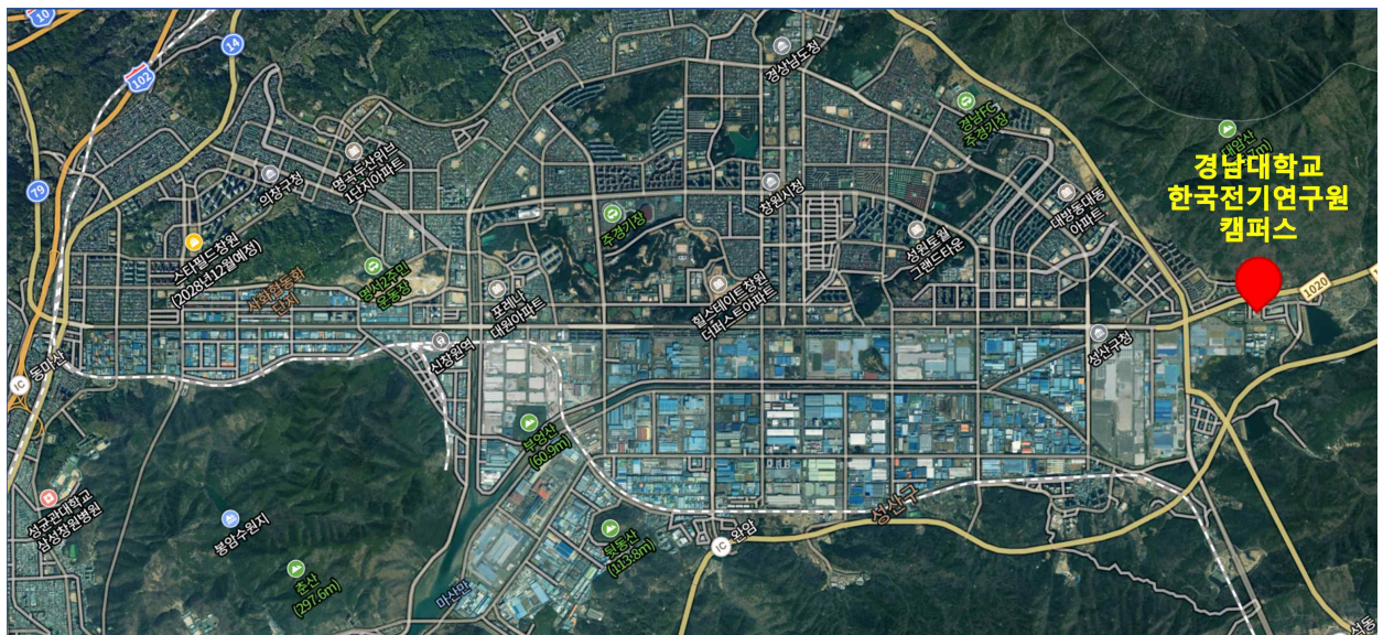
<경남대학교 한국전기연구원캠퍼스(창원국가산업단지 내 위치)>